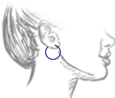
Hoops | Créoles | Argolas