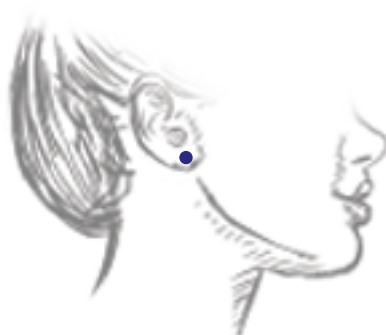
Studs | Pucês | Brincos de Placa