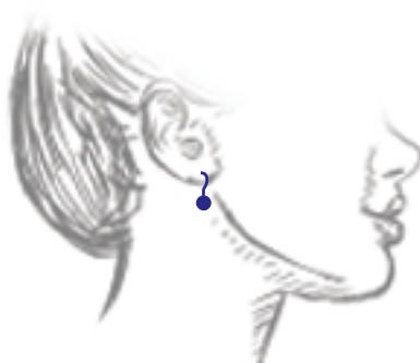
Drops | Pendants | Pendentes